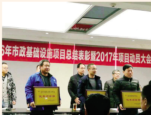
2月22日,西安国家民用航天产业基地-西安航天城投资发展集团有限公司召开2016年市政基础设施项目总结表彰暨2017年项目动员大会,由集团公司承建的航天中路(航天西路-神舟二路)工程项目部荣获2016年度优秀项目部荣誉称号。