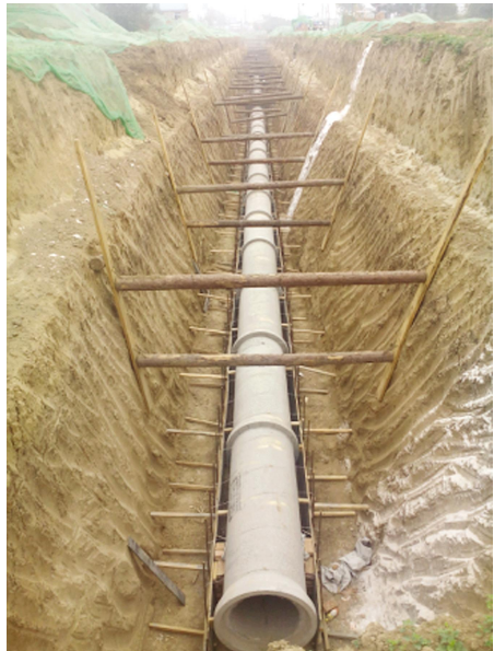
大寨路是西安市一条东西方向的城市次干道,西起南绕城高速路,东至唐延路,工程全